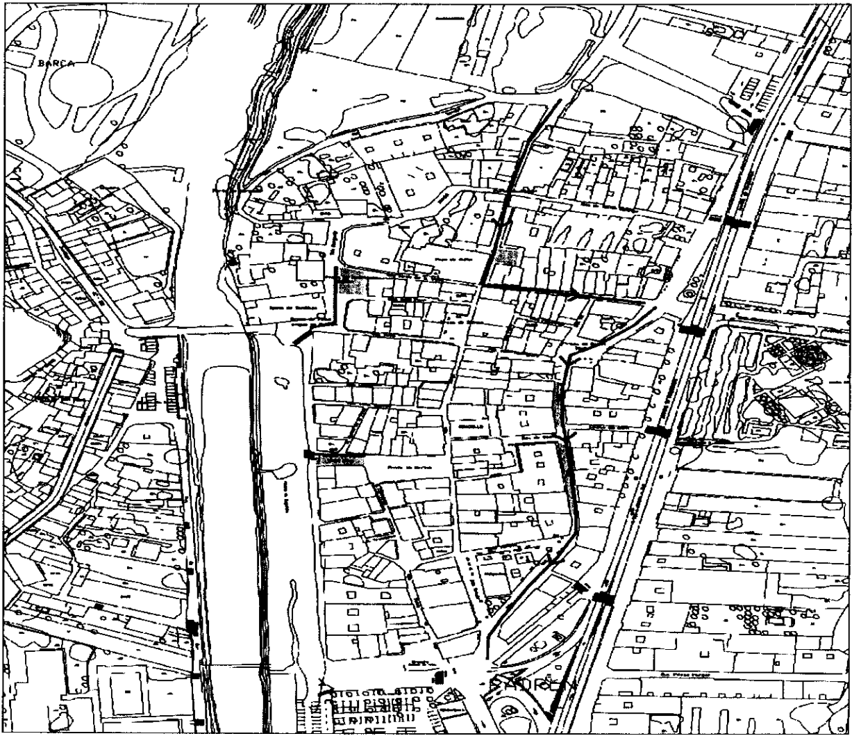
PLANO 2 INDICATIVO DE RUAS CON CIRCULACIÓN PERMITIDA PARA ACTUACIONES DE CARGA E DESCARGA E ZONAS HABILITADAS PARA CARGA E DESCARGA. RUAS: RUA REAL - PRAZA DE C.J.CELA - RUA DO LORES - RUA ROSALIA DE CASTRO - PRAZA DE FILLOS E AVOGOS DE PADRÓN - PRAZA DE RODRIGUEZ COBIÁN. ZONAS: PRAZA DE C.J.CELA - PRAZA DE RODRIGUEZ COBIÁN - PRAZA FRENTE PALACIO DE QUITO - PRAZA DE RAMON TOXO - PRAZA DO CASTRO - FINAL DA RUA REAL (FRONTE OS XULGADOS) .

Non habendo ningunha intervención, o Presidente somete a proposta a votación ordinaria co resultado de todos os votos a favor, polo que o Pleno da Corporación acorda por unanimidade das concelleiras e dos concelleiros presentes aprobar a proposta de data 19 de decembro de 2016 nos termos expresados anteriormente.