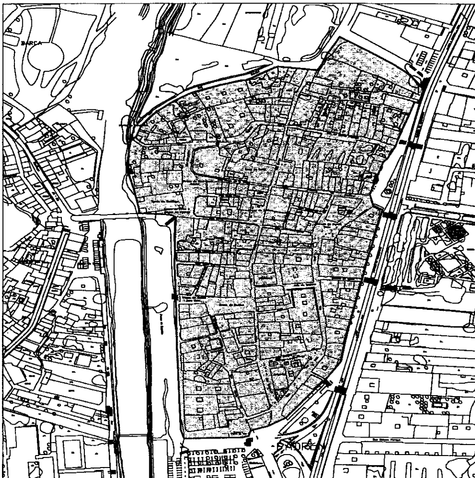
PLANO 1 INDICATIVO DO RECINTO DELIMITADOR DE VIAS DE USO PEONIL: RUA CASTELAO - RUA DA PORTA DE FONDO DE VILA - AVENIDA DE COMPOSTELA - RUA DO BORDEL.